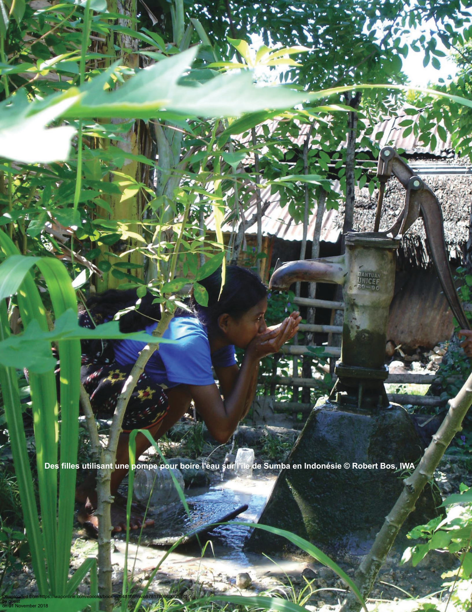
Des filles utilisant une pompe pour boire l'eau sur l'île de Sumba en Indonésie