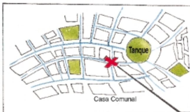
Mapa de la comunidad: fugas en la red

La capacitación es un elemento clave para aprender. El marco institucional deja claro que las institu-